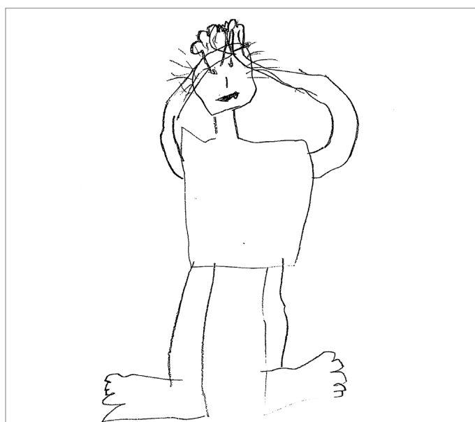
Abb. 1: Leandro 6 9/12 Jahre mit Migräne ohne Aura (man beachte die Schmerzintensitätsdarstellung gemäss VAS-Skala=Visual Analogue Scale 0-10)

Bestimmte Elemente aus Kopfschmerzzeichnungen können zusätzlich diagnostisch hilfreich sein (Abbildungen 1 und 2). Nebst der Anamnese ist eine ausführliche, neurologische Untersuchung mit besonderem Augenmerk auf Stauungspapillen, Augen-